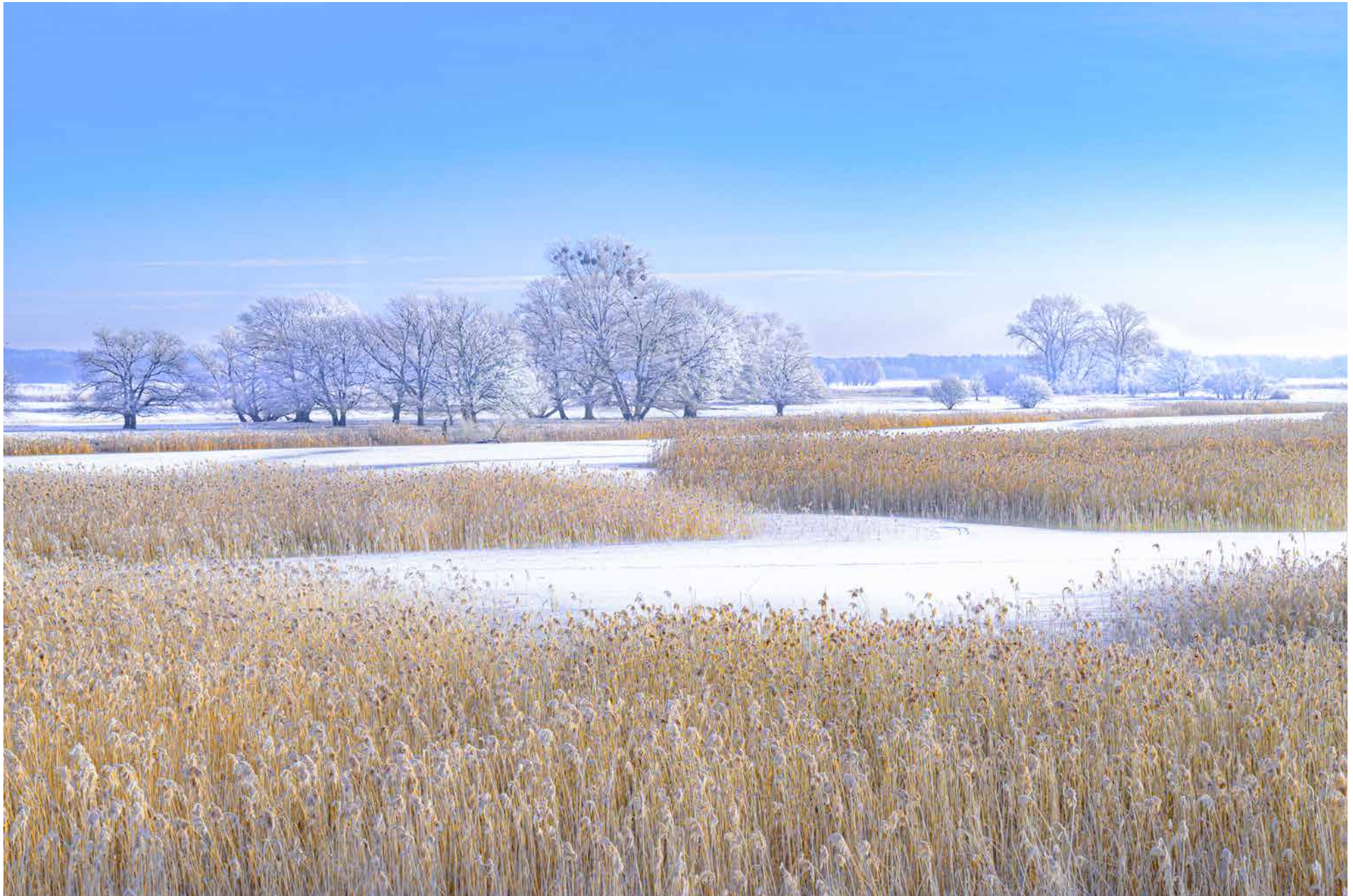
Bei Groß Neuendorf

1 2 3 4 5 6 7 8 9 10 11 12 13 14 15 16 17 18 19 20 21 22 23 24 25 26 27 28 29 30 31 So Mo Di Mi Do Fr Sa So Mo Di Mi Do Fr Sa So Mo Di Mi Do Fr Sa So Mo Di Mi Do Fr Sa So Mo Di