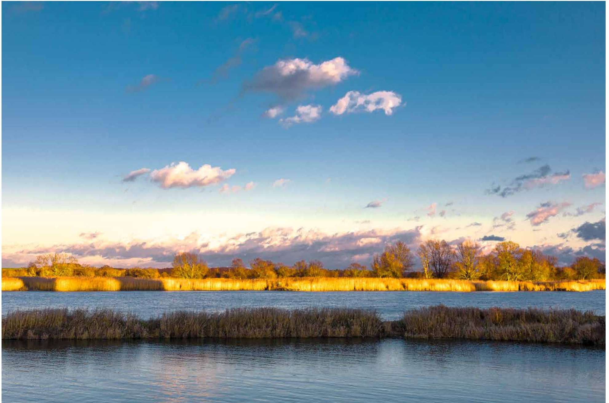
Groß Neuendorf, Hafen

1 2 3 4 5 6 7 8 9 10 11 12 13 14 15 16 17 18 19 20 21 22 23 24 25 26 27 28 29 30 31 So Mo Di Mi Do Fr Sa So Mo Di Mi Do Fr Sa So Mo Di Mi Do Fr Sa So Mo Di Mi Do Fr Sa So Mo Di