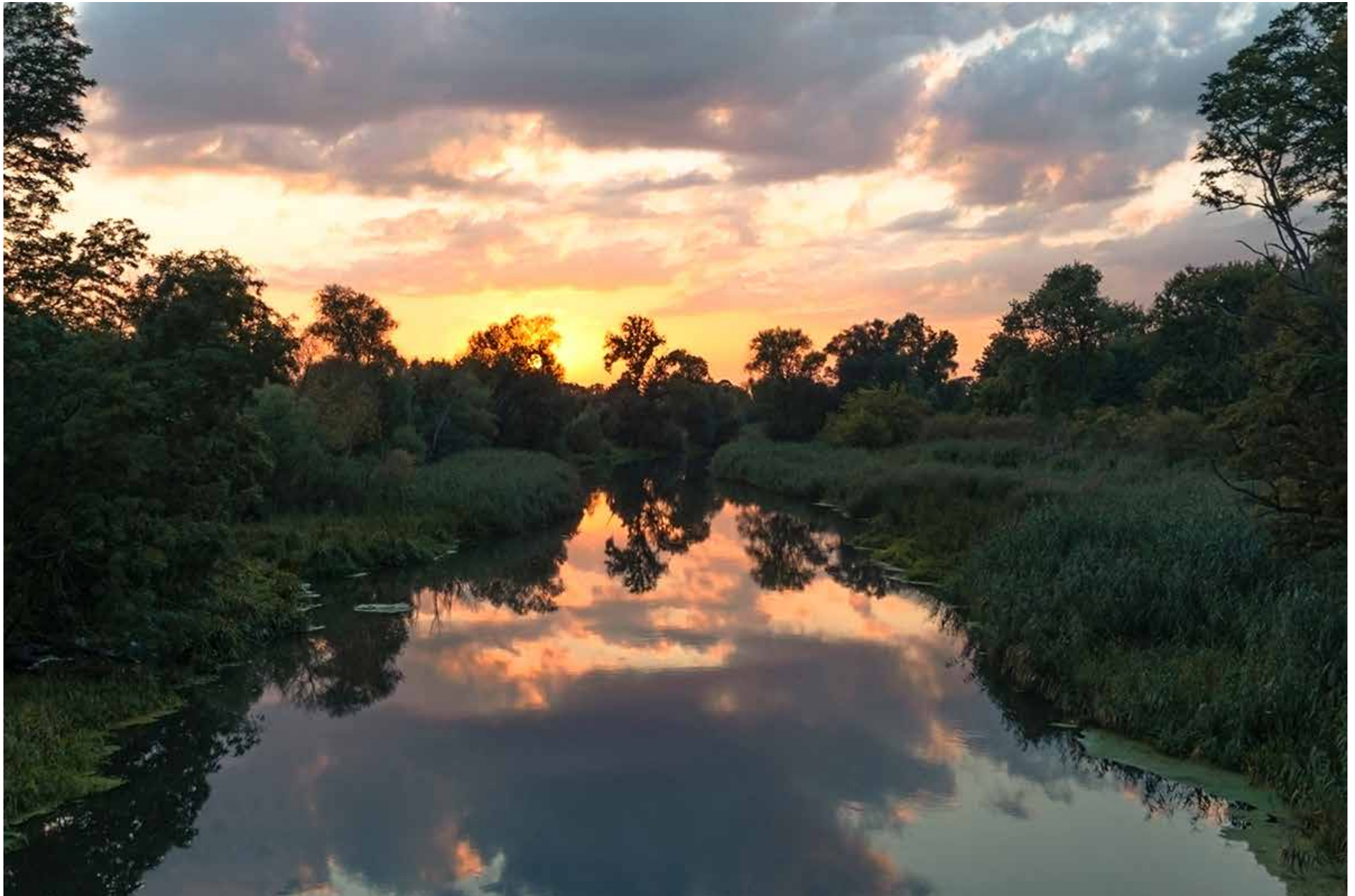
Alte Oder bei Zuckerfabrik/Altranft

1 2 3 4 5 6 7 8 9 10 11 12 13 14 15 16 17 18 19 20 21 22 23 24 25 26 27 28 29 30 Fr Sa So Mo Di Mi Do Fr Sa So Mo Di Mi Do Fr Sa So Mo Di Mi Do Fr Sa